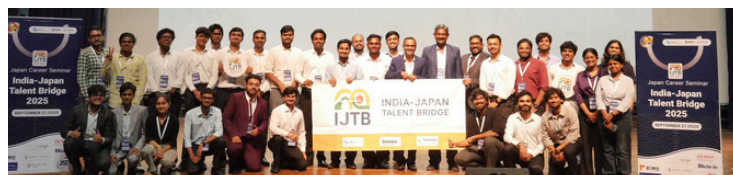
本年度実施した「インド啓発ツアー」の様子

主催：経済産業省 共催：在福岡インド総領事館、九州経済産業局 協力：福岡商工会議所 運営：India-Japan Talent Bridge事務局 （デロイトトーマツベンチャーサポート株式会社、Tech Japan株式会社） お問い合わせ先：india_hr_exchange_support@tohmatu.co.jp india_hr_exchange_support@techjapan.work