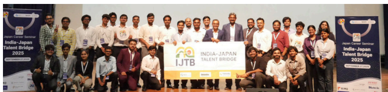
本年度実施した「インド啓発ツアー」の様子